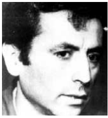
MARIO ROBERTO SANTUCHO