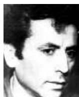
MARIO ROBERTO SANTUCHO

Este periódico ha sido editado e impreso con el aporte del pueblo trabajador